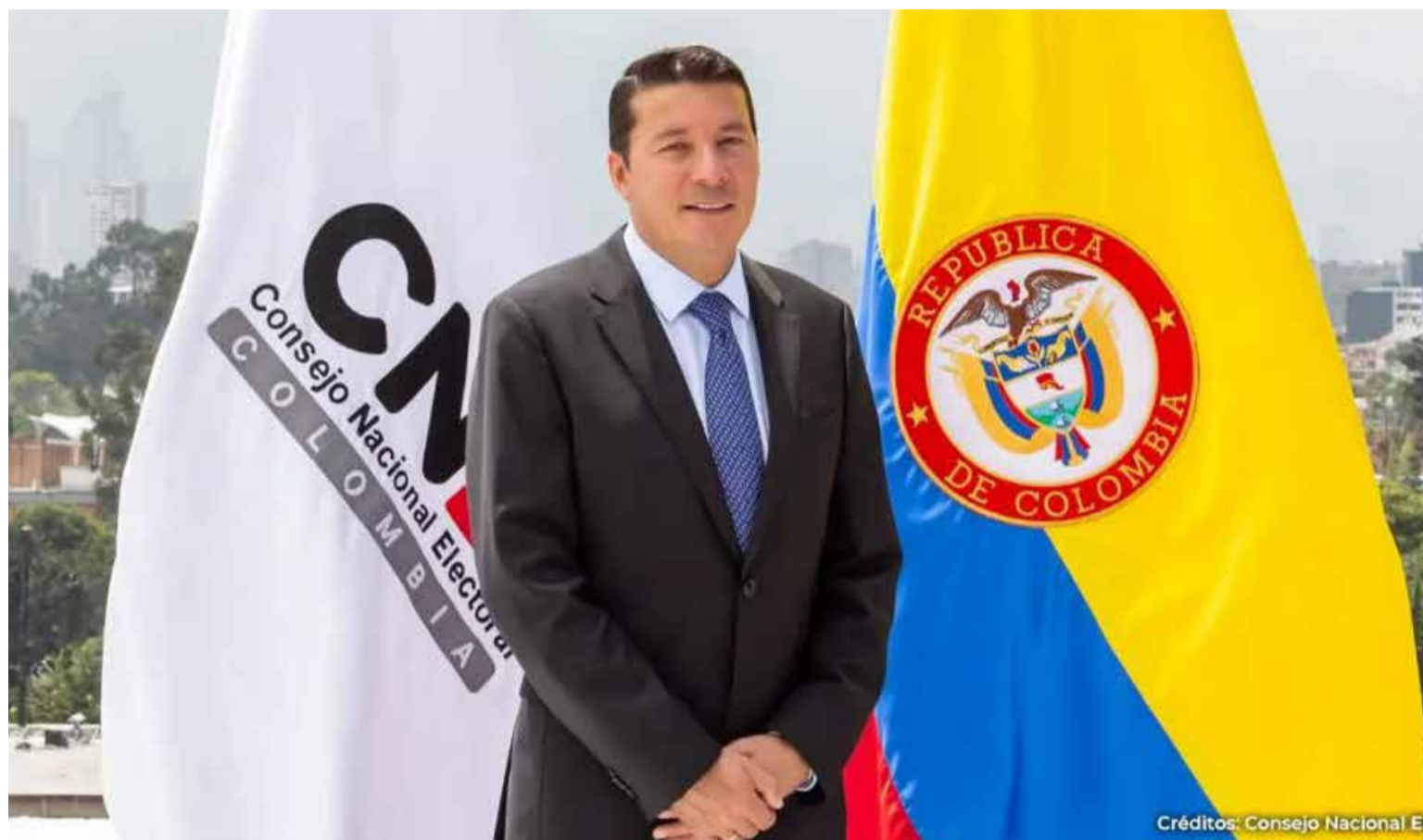
Hernán Penagos Giraldo, Registrador del Estado Civil