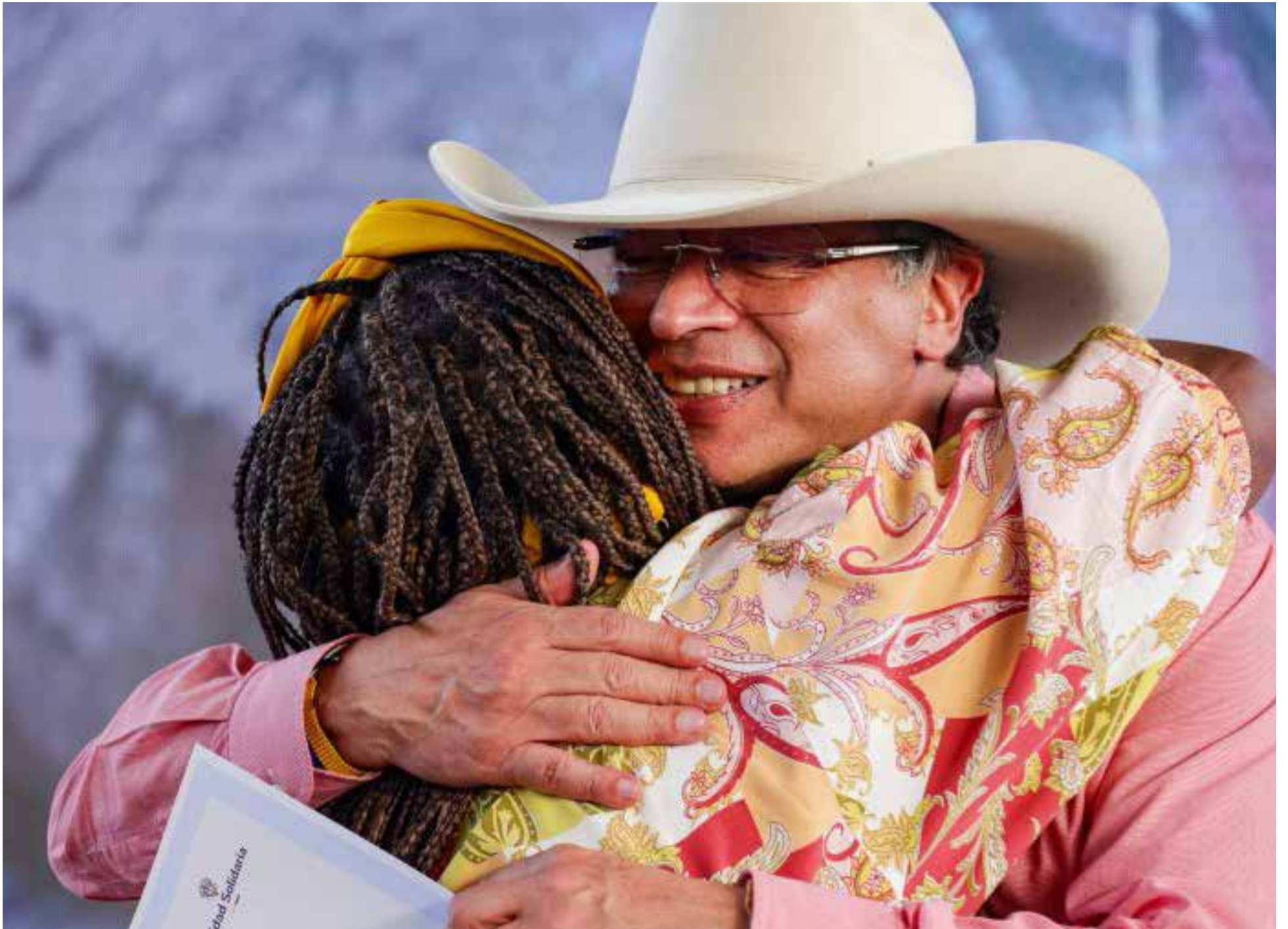
Gustavo Petro Urrego, presidente de Colombia