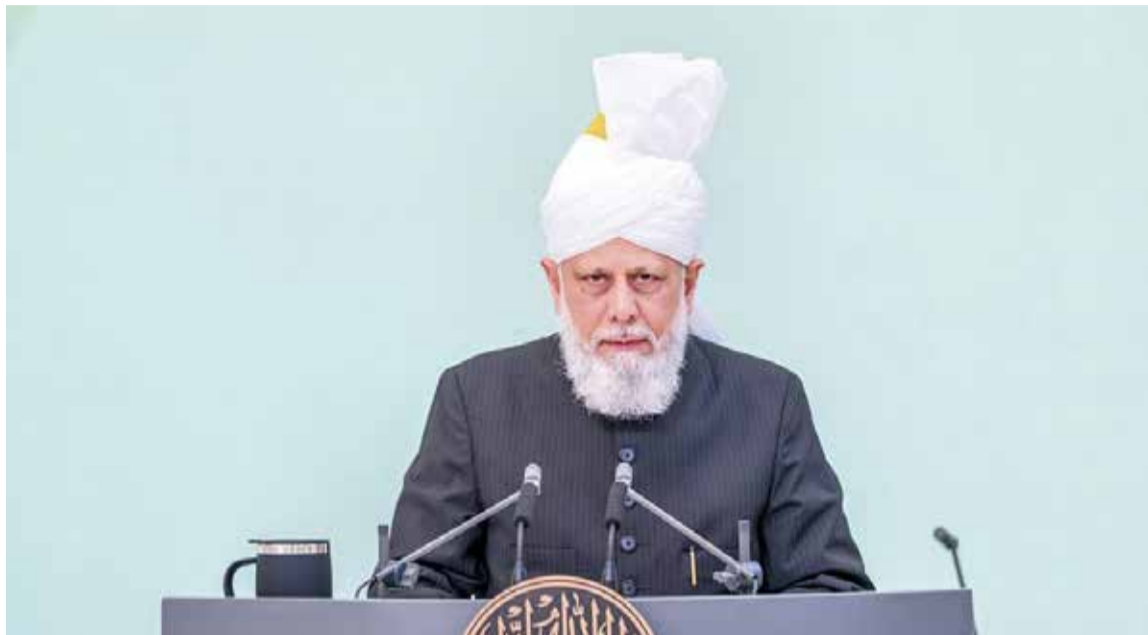
Su Santidad Mirza Masrur Ahmad es el quinto Jalifa de la Comunidad Musulmana Ahmadía, una voz global por la paz y la justicia. Dedica su liderazgo a difundir el verdadero mensaje del Islam de amor, servicio a la humanidad y unidad global.