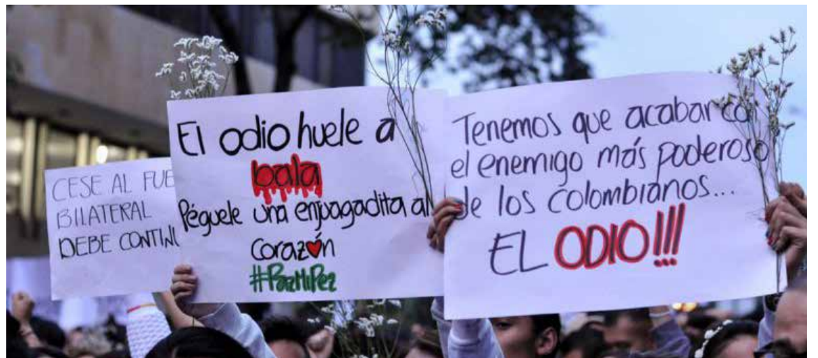
Un contundente llamado a la nación fue emitido por estudiantes colombianos, quienes exigieron poner fin al ciclo de odio, mentira, calumnia y manipulación que consideran está fracturando el tejido social del país. Su mensaje subraya la urgencia de construir un ambiente de diálogo y respeto mutuo.

Otros aprovecharon la presencia de medios para «pontificar de la paz», a pesar de haber impulsado la polarización. De hecho, una precandidata fue vista buscando activamente interactuar con los asistentes, acompañada de un equipo de cámaras, en un aparente intento de posar de líder y manipular la percepción pública de un supuesto respaldo masivo.