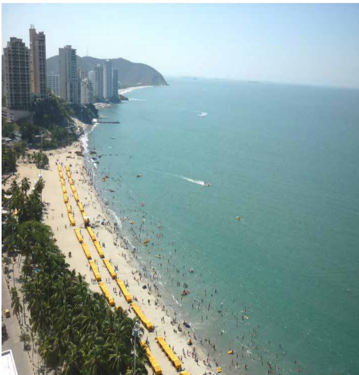
Playa El Rodadero en Santa Marta