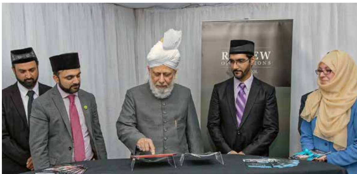
Mirza Masrur Ahmad, el quinto Jalifa de la Comunidad Musulmana Ahmadía, posee un notable poder de convocatoria mundial, reuniendo a millones de seguidores y líderes de diversas esferas. Su mensaje de paz y servicio a la humanidad resuena globalmente, atrayendo audiencias en plataformas internacionales y promoviendo la unidad.