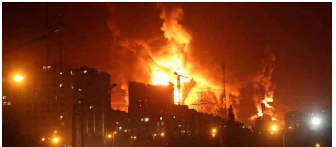
Israel Ataca Depósito de Combustibles Estratégico en Irán

Analistas internacionales advierten que, a pesar del interés de ambos bandos por evitar una guerra total, el riesgo de un error de cálculo o una escalada incontrolable sigue siendo extremadamente alto.