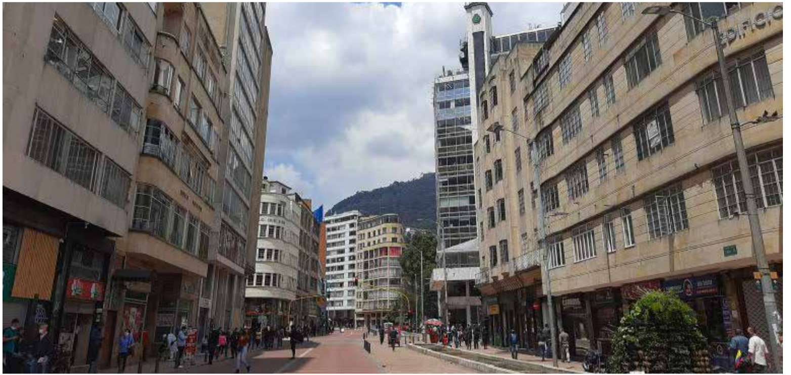
El Eje Ambiental de Bogotá o la Avenida Jiménez. Los indígenas caucanos al derribar la estatua de Gonzalo Jiménez de Quezada mediante un ritual la bautizaron como Avenida Misak.

Por la calle caminan al unísono habitantes de calle, con oficinistas