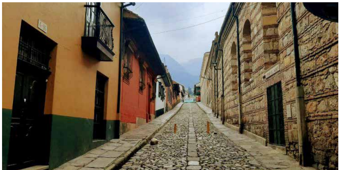
El centro de Bogotá también alberga el sector histórico de Colombia.

ves daños con sus excrementos. Cada semestre, sacan más de 60 toneladas. La limpieza que hubo que hacerle para la visita del Papa Francisco costó 200 millones de pesos, pero sólo duró resplandeciente unas semanas. Sin embargo, los daños de las aves no se acercan a los ocasionados por los legisladores cada año, unos metros al sur, en el Palacio del Congreso.