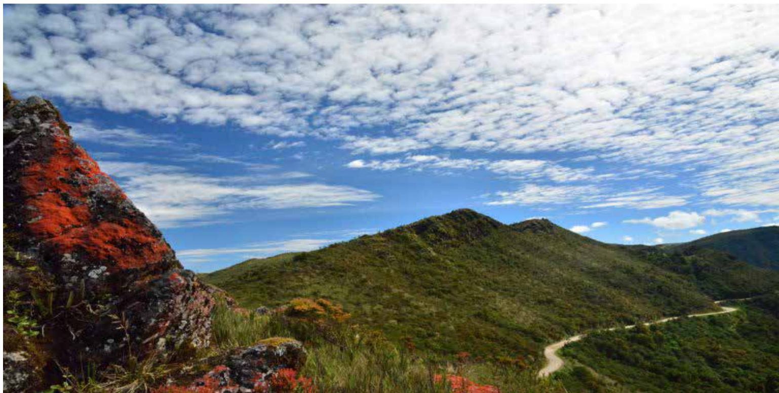
Parque nacional Natural Chingaza. Colombia

E l turismo se consolida como un pilar fundamental de la economía colombiana, superando las exportaciones de carbón y café en el primer trimestre de 2025. Así lo anunció el presidente Gustavo Petro en su cuenta de X, destacando cifras del DANE y el Banco de la República que confirman este hito.