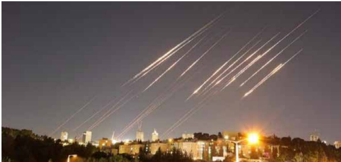
Lluvia de Misiles Iraníes Sacude Israel