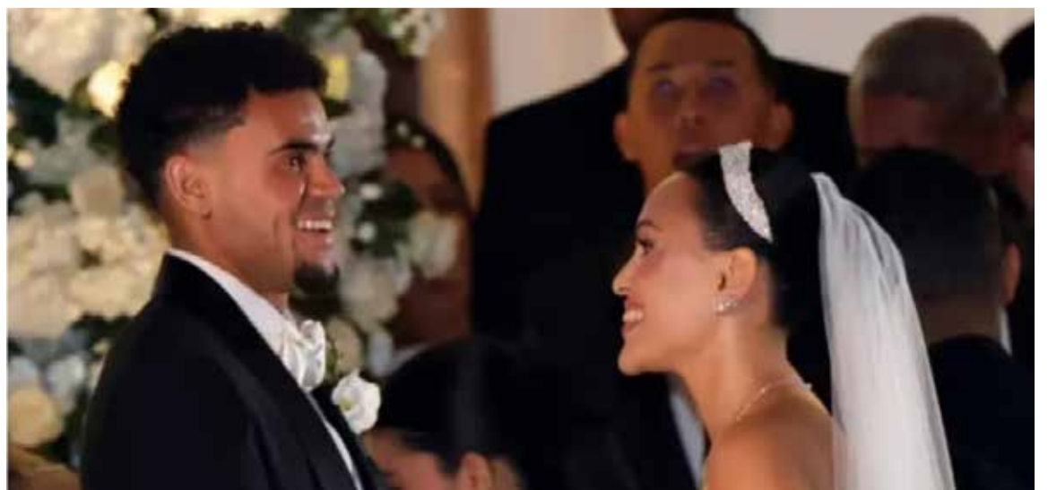
La boda de Lucho Díaz no solo fue un evento social, sino también un encuentro de grandes talentos.

Desde el inicio, el futbolista había dejado clara su intención de que el evento fuera un asunto íntimo, reservado para familiares y amigos cercanos. Esta postura se mantuvo firme, frustrando las expectativas de aquellos que, a través de diversas «maniobras», según fuentes cercanas, buscaban ser parte de la exclusiva lista de invitados. El resultado fue una celebración privada, lejos de los focos mediáticos y las apariciones públicas con figuras políticas, preservando el ambiente deseado por los recién casados.