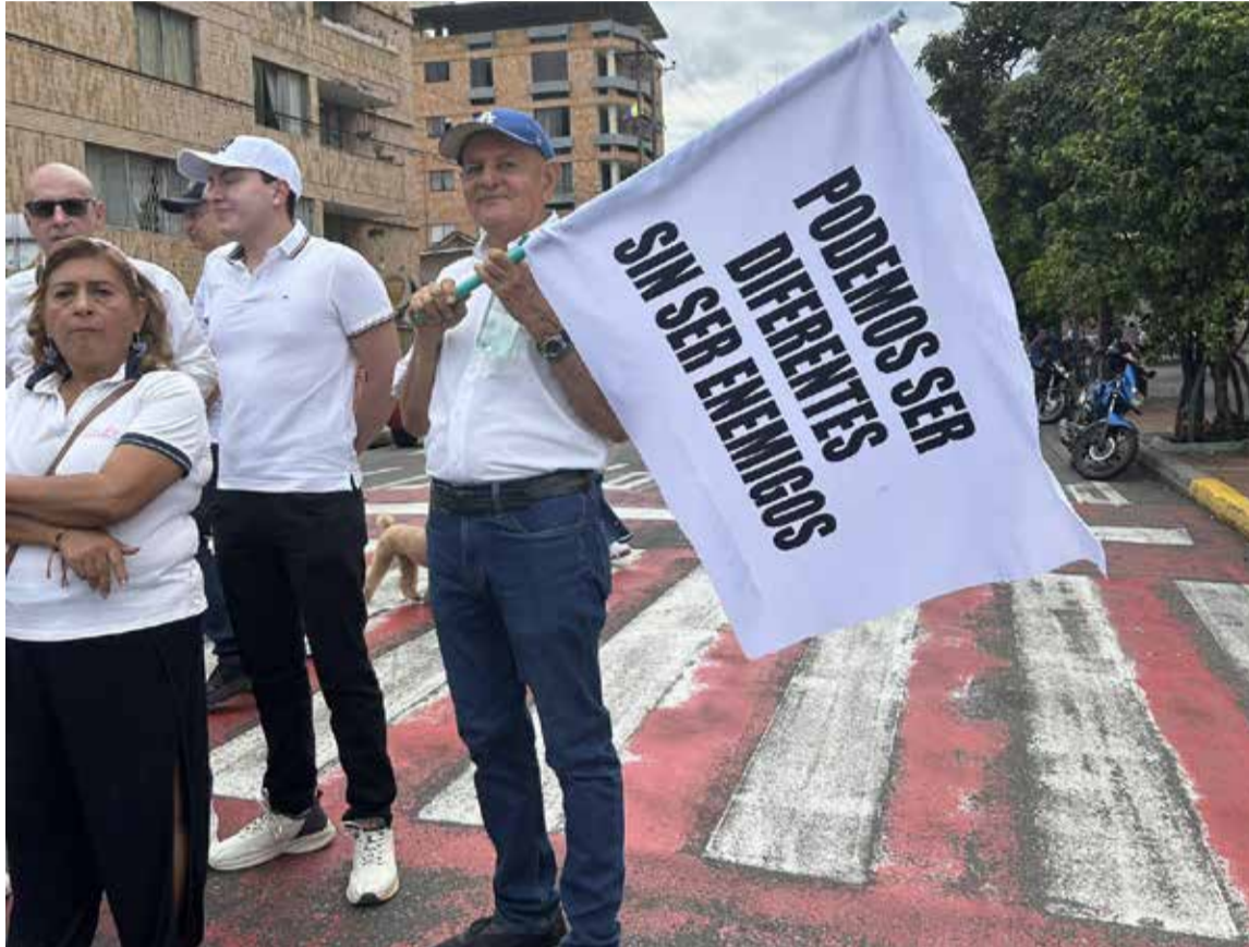
El mejor mensaje de la Marcha del Silencio

Voces en la Marcha: Entre la Preocupación y el Oportunismo