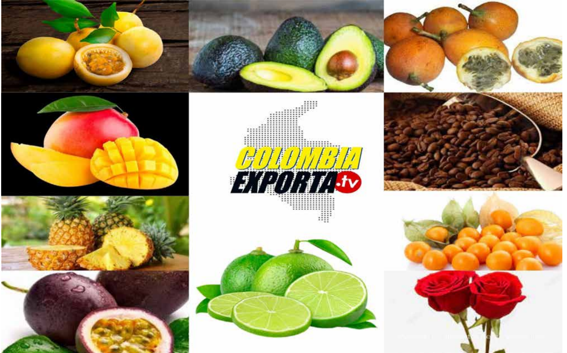
Alimentos que se ha incrementado en exportaciones