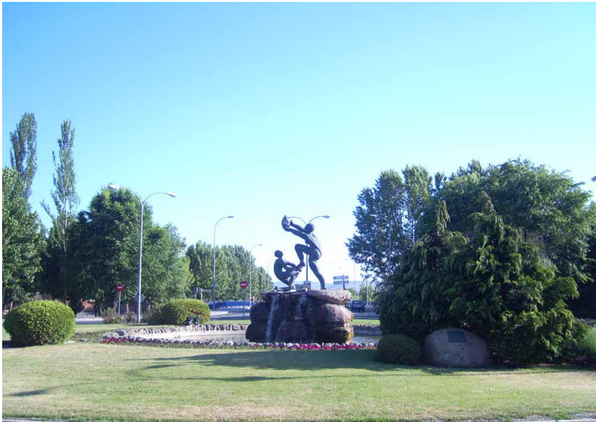
El Monumento a los Donantes de Sangre en Ávila

El mundo se une para honrar a los héroes anónimos que, con un acto voluntario y generoso, salvan vidas: los donantes de sangre. En LaCardio, nos unimos a esta conmemoración, resaltando el valor incalculable de cada donación y el impacto positivo que genera en miles de pacientes cada día.